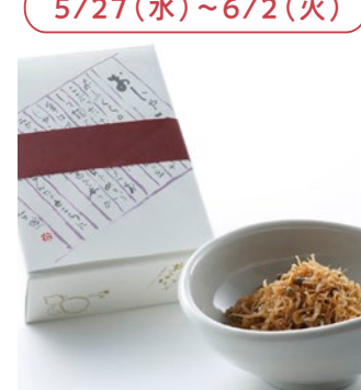
「祇園やよい」 (京都府) ちりめん山椒・おじゃこ