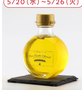
「GARLIO」 (和歌山県) ガーリックオリーブオイル