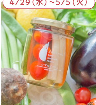
「いずみピクルス」 (大阪府) 水なすピクルス和風mix