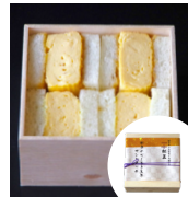
「京料理 松正」 (京都府) 料亭のだし巻き 玉子サンドイッチ (4個入) 756円 ※1/3(金)の入荷はございません。