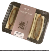
「グリル梵」 (大阪府・新世界) 牛すじコロケ サンド (4切入) 801円