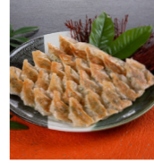
「ひとくち餃子 発祥店 天平」 (大阪府・北新地) 生ひとくち餃子 (30個) 2,160円