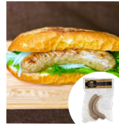
「飛騨高山ブレジャー」 (岐阜県) プレミアムトリュフ ソーセージ (120g) 1,480円