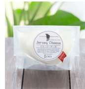
「丹後ジャージー牧場 ミルク工房そら」 (京都府) ナチュラルチーズ モッツアレラ (100g) 751円