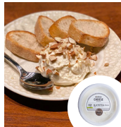
「寿商会 コトブキチーズ」 (鹿児島県) カノヤチーズ (170g) 594円