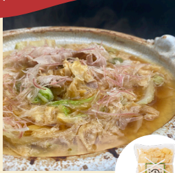
「千丸屋」(京都府) 徳用ゆば (160g) 1,728円 ※写真はイメージです。

千丸屋本店のおもたせでも人気の商品で、炊飯時に入れれば炊き込みご飯になり、お味噌汁や煮物にもお使いいただけます。寒い時期はお鍋に入れてお召し上がりください。