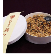
「丸萬本家」 (大阪府・住吉区) 鯛めし (1折) 1,350円 ※1/4(土)の入荷はございません。