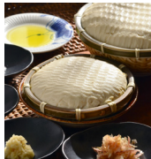
「京の地豆腐 久在屋」 (京都府) もてなし豆腐 (270g) 594円