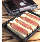
「グリル梵」 (大阪府・新世界) ビーフ ヘレカツサンド (4切入) 1,201円