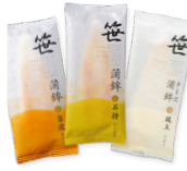
「高政」 (宮城県) 笹かまぼこ ・吉次 (1枚) 216円 ・石持 (1枚) 195円 ・蔵王 (1枚) 195円