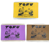
「YACCO豆腐店」 (兵庫県) ・とうもろこし豆腐 ・安納芋豆腐 ・山芋豆腐 (300g) 各400円 ※1/3(金)の入荷はございません。