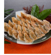
「ひとくち餃子 発祥店 天平」 (大阪府・北新地) 生ひとくち餃子 (30個) 2,160円