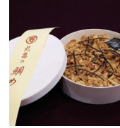
「丸萬本家」 (大阪府・住吉区) 鯛めし (1折) 1,350円