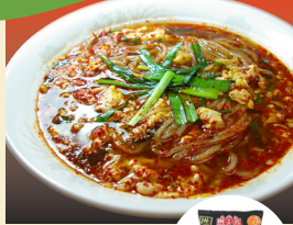
「辛麺屋 柘元」 (宮崎県) 辛麺 (1食入) 601円 ※写真はイメージです。卵は入っておりません。

ニンニク・ニラ・シソの旨味が合わさった醤油ベースのスープはクセになる味。お好みで溶き卵を混ぜ入れ、同封の唐辛子を適量入れてお召し上がりください。商品には麺、スープ、かやく、唐辛子が入っております。