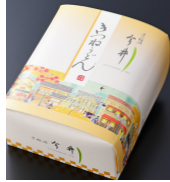
「道頓堀 今井」 (大阪府・道頓堀) お手軽きつねうどん (1人前) 864円