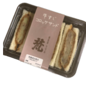
「グリル梵」 (大阪府・新世界) 牛すじロック サンド (4切入り) 801円