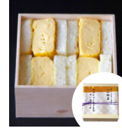
「京料理 松正」 (京都府) 料亭のだし巻き 玉子サンドイッチ (4個入り) 756円