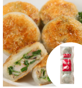
「同發」 (横浜) 苺菜餅 (5個入) 1,401円