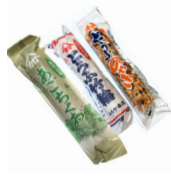
「からや商店」 (鳥取県) ・とうふ竹輪 (110g) 173円 ・とうふのやき (110g) 173円 ・あごちくわ (130g) 713円