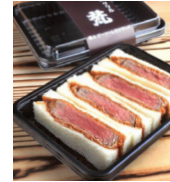
「グリル梵」 (大阪府・新世界) ビーフ ヘレカツサンド (4切入り) 1,201円