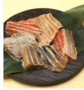
「京粕漬 魚久」 (東京都) 切り落とし (1袋) 864円 ※「京粕漬 魚久」のカウンターにて承ります。 ※中身が変わる可能性があります。 ※お一人さま1個とさせていただきます。