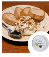
「寿商会」 コトブキチーズ」 (鹿児島県) カノヤチーズ (170g) 594円