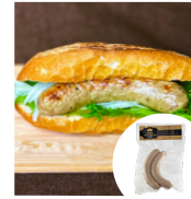
「飛騨高山プレジャー」 (岐阜県) プレミアムトリュフ ソーセージ (120g) 1,480円