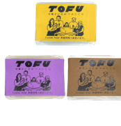
「YACCO豆腐店」 (兵庫県) ・とうもろこし豆腐 ・安納芋豆腐 ・山芋豆腐 (300g) 各400円